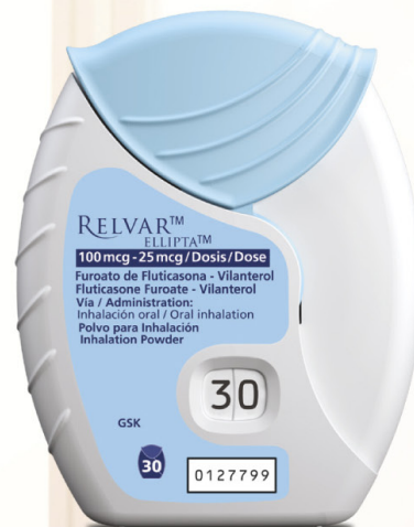
RELVAR ® ELLIPTA® (furoato de fluticasona / vilanterol)

Relvar® Ellipta® INVIMA 2016M-0017469 Incruse® Ellipta® INVIMA 2016M-0017469