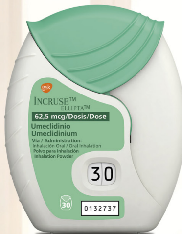
INCRUSE ® ELLIPTA® umeclidinio