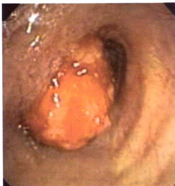
Figura 2. Masa exofítica en pared lateral izquierda de la tráquea que obstruye el 90% de la luz.