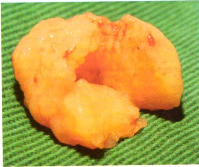
Figura 3. Pieza de resección por broncoscopia rígida.